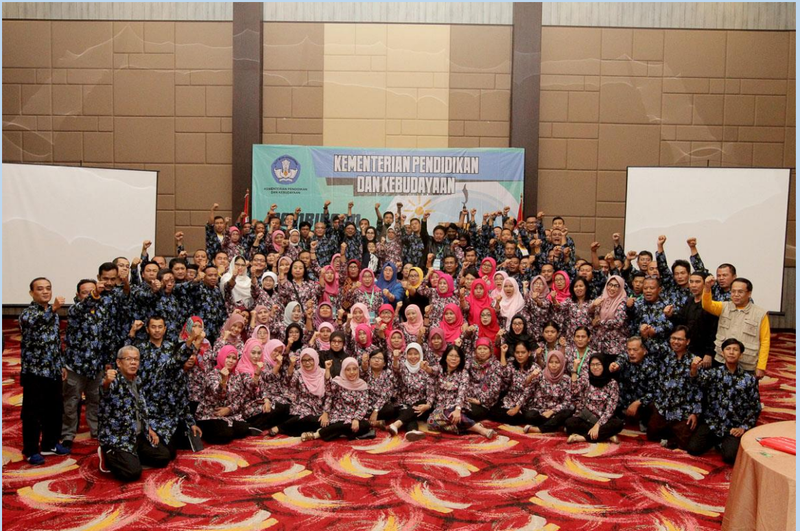
Foto Bersama Keluarga Besar Direktorat Pembinaan SMA